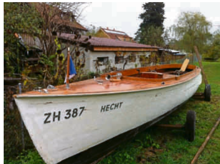
Der «Hecht» heute. 2017 soll er wieder auf dem Pfäffikersee eingesetzt werden.

Damit er nicht noch mehr Schaden nimmt, ist er inzwischen bei der Firma Helbling Bootsbau in Jona eingelagert. Diese soll auch die Sanierung übernehmen. Obwohl die Sub-